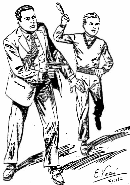
"Roberto Alcázar y Pedrín" trenta quatre anys com a herois imbatuts.