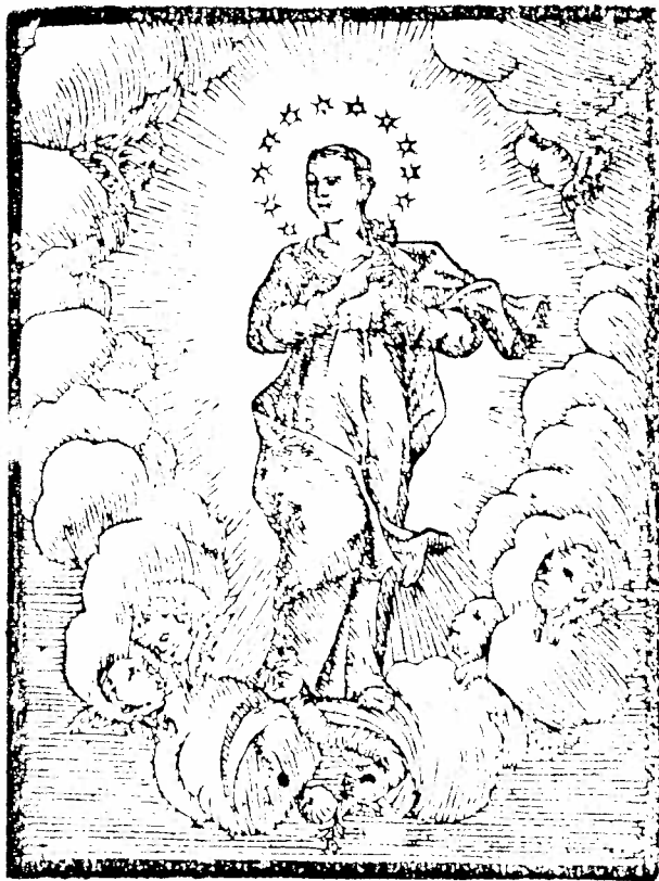
MARE DE DÉU DE LA CONCEPCIÓ