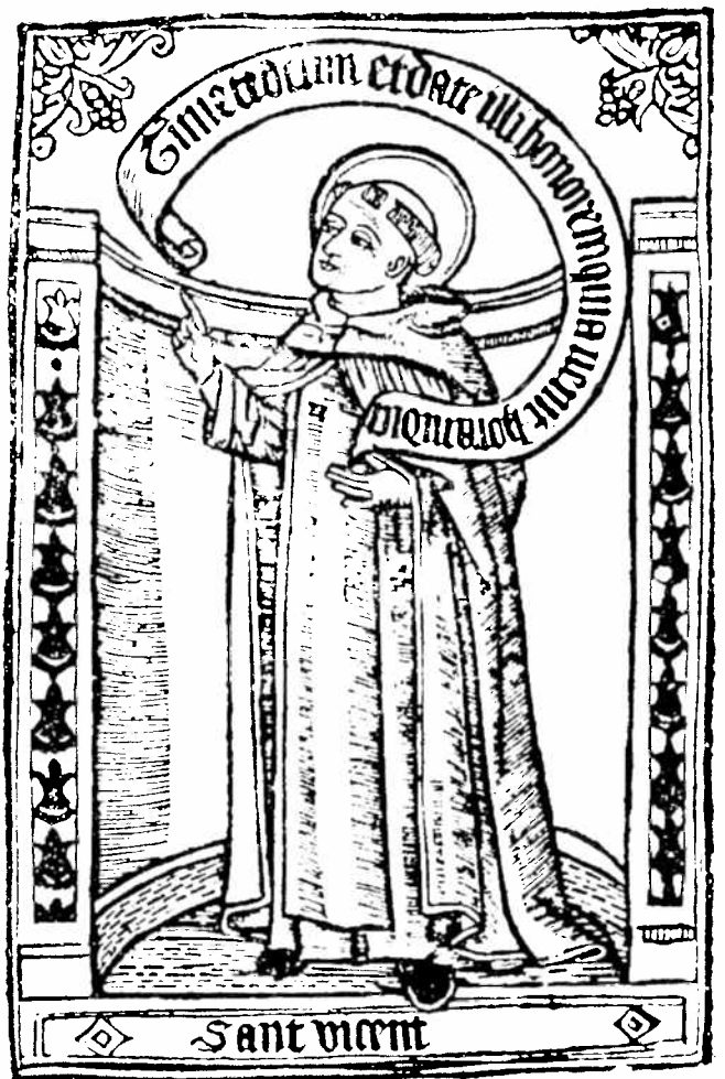
SANT VICENT FERRER