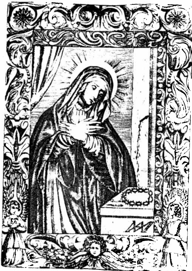
VERGE MARIA DE LA SOLEDAT